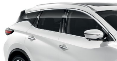
Белый перламутр — QAB