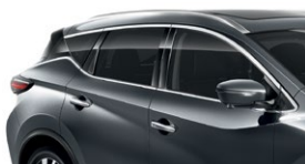
Темно-серый — KAD