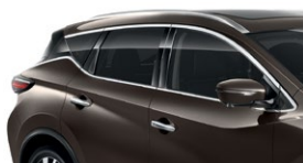
Серо-коричневый — CAM