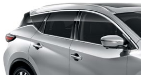
Серебристый — K23