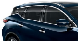
Темно-синий — RBG