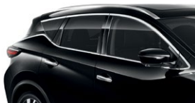
Черный — G41