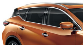
Оранжевый — EAW